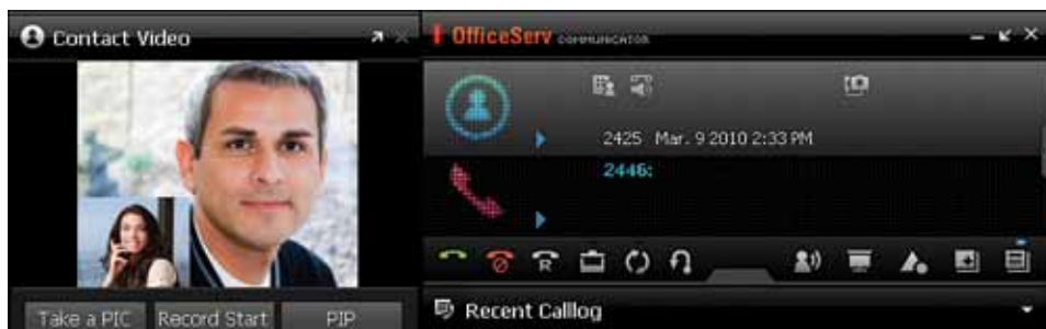
OfficeServ Communicator – appel vidéo

Si vous voulez avoir un meilleur contrôle d'appel et que vous recherchez un système plus convivial, OfficeServ Communicator Basic a ce qu'il vous faut. Vous pouvez facilement obtenir la liste des appels entrants et sortants et cliquer sur la touche de recomposition pour retourner les appels reçus en votre absence.